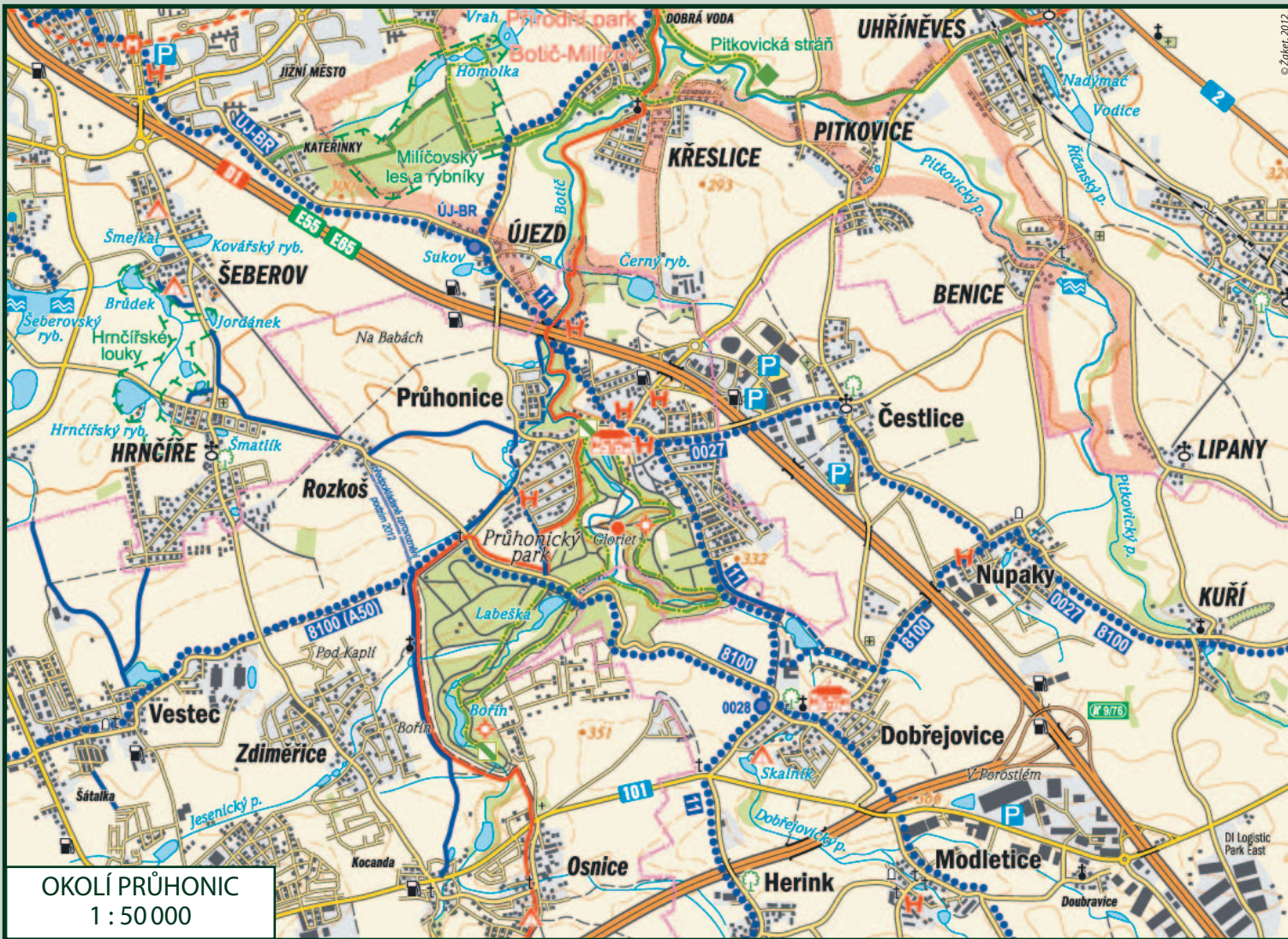
OKOLÍ PRŮHONIC 1 : 50 000